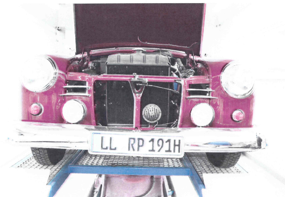
Bild 5 Chromteile schadensfrei und ordentlich