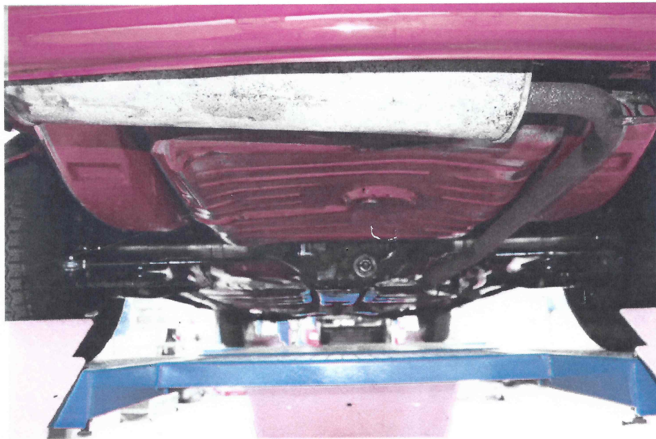
Bild 7 Aggregate original und überholt