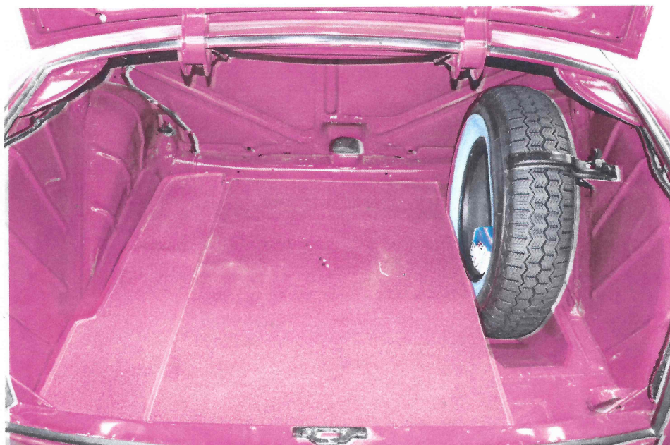
Bild 4 Innenraum original und gepflegt