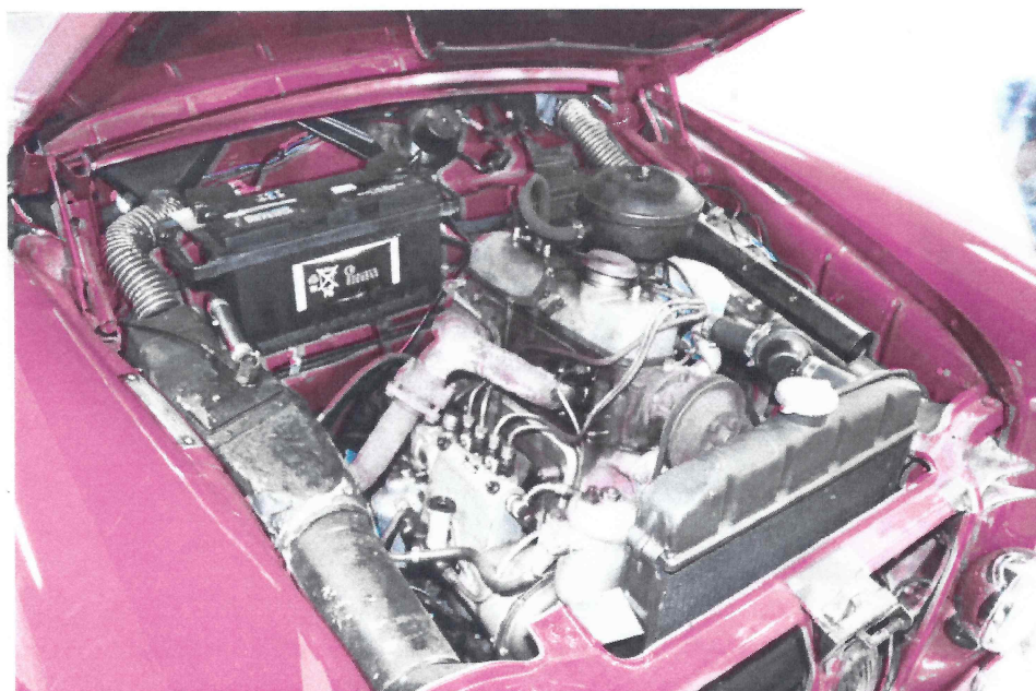
Bild 6 180 D Motor, gepflegt