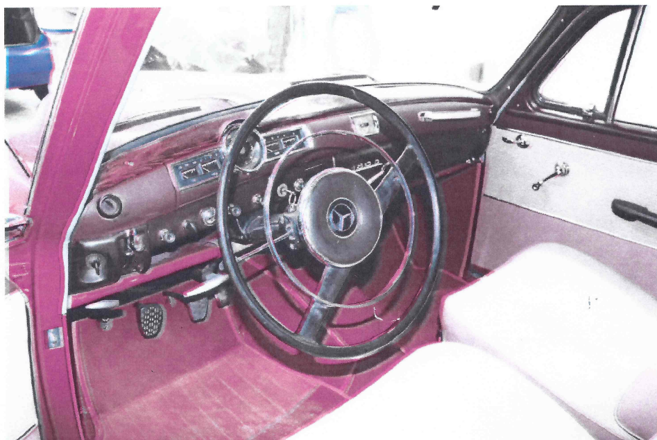
Bild 3 Innenraum original und gepflegt